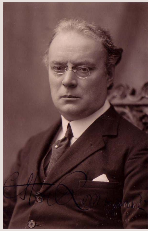
ETTORE ROMAGNOLI 1871-1938, studente al Regio Liceo Classico – Ginnasio “Umberto I”, Roma, 1885-1890 https://it.wikipedia.org/wiki/Ettore_Romagnoli_(grecista)#/media/File:Ettore_Romagnoli.jpg