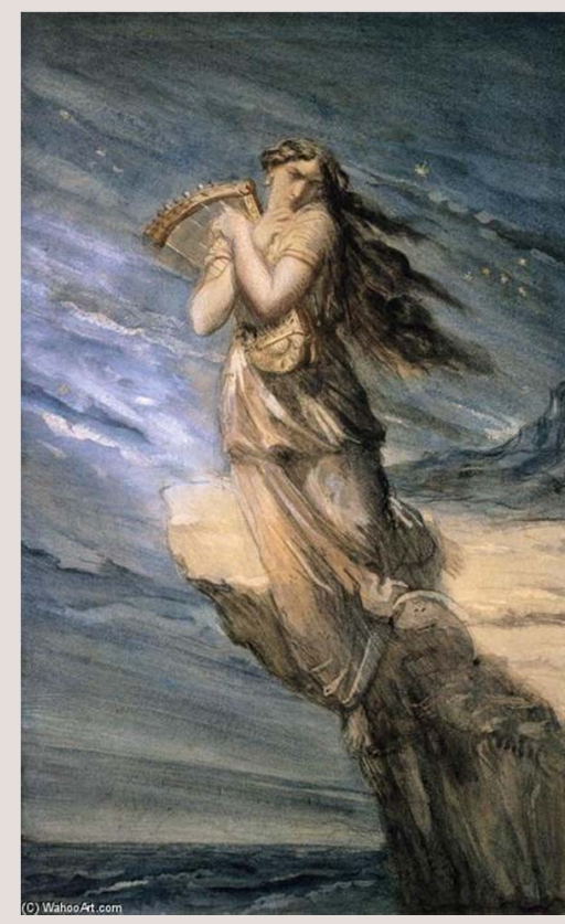
Théodore Chassériau , Saffo. Saltando nel mare dal Leucadian promontorio , 1840, Museo del Louvre. https://it.artsdot.com/@/@/8Y3VXN-Th%C3%A9odore-Chass%C3%A9riau-saffo-saltando-nel-mare-dal-Leucadian-Promontorio